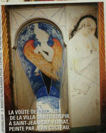
LA VOÛTE DE L'ESCALIER DE LA VILLA SANTO SOSPIR, À SAINT-JEAN-CAP-FERRAT, PEINTE PAR JEAN COCTEAU.