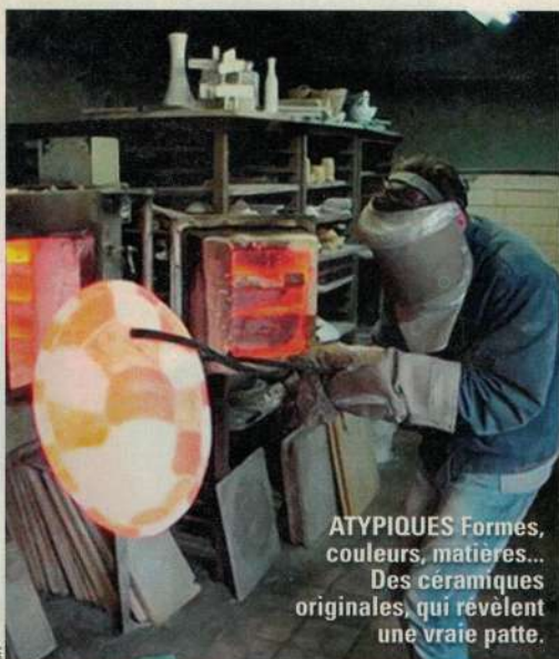
ATYPIQUES Formes, couleurs, matières... Des céramiques originales, qui révèlent une vraie patte.

Céramique Massier , 49 et 69 bis, av. Georges-Clemenceau, Vallauris, 06-65-17-60-88 et www.ceramique-massier.com