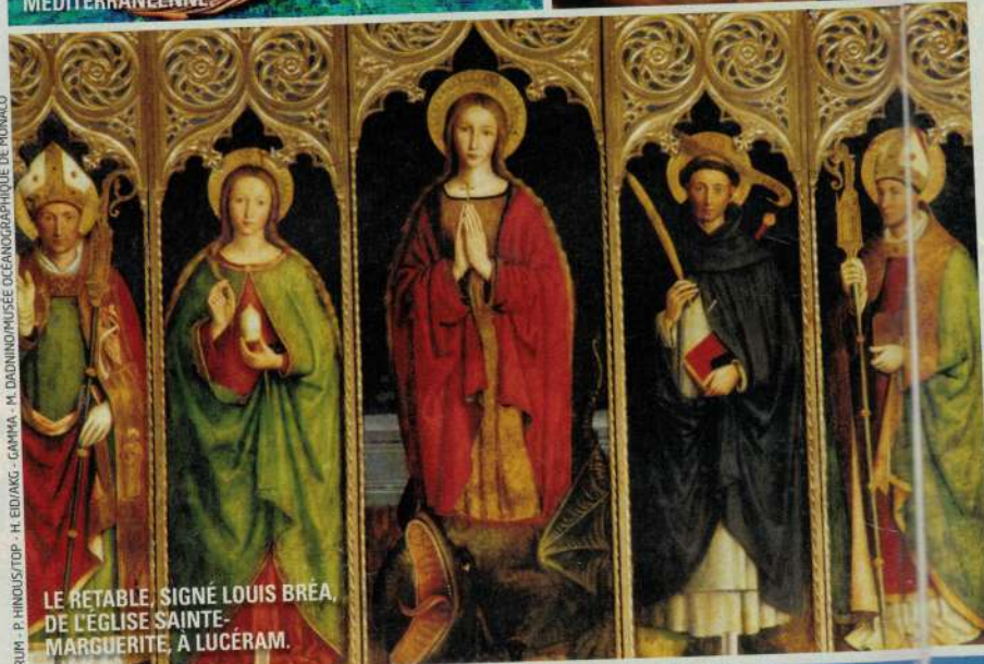
LE RETABLE, SIGNÉ LOUIS BRÉA, DE L'ÉGLISE SAINTE-MARGUERITE, À LUCÉRAM.