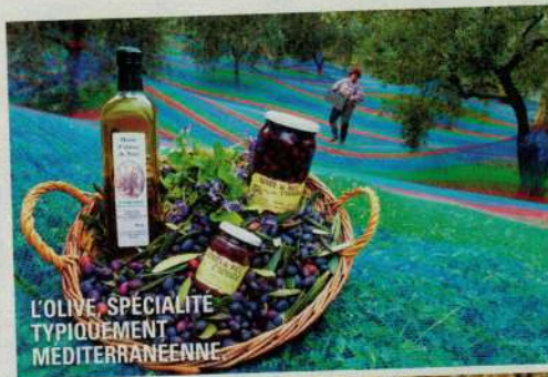
L'OLIVE, SPÉCIALITÉ TYPIQUEMENT MÉDITERRANÉENNE

À LIRE Côte d'Azur, Monaco, le Guide Vert, Michelin, 17,90 € ; Côte d'Azur, Géo Guide, Gallimard, 13,90 € ; Côte d'Azur, le Guide du Routard, Hachette, 11,90 €.